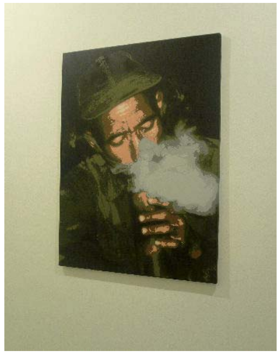
- Silencio (Danemark)